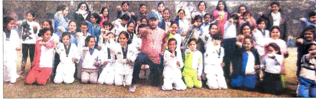
प्रशिक्षण कार्यक्रम में छात्राओं के साथ कोच।